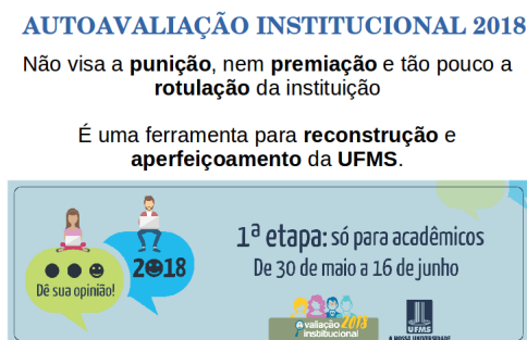
Figura 3: Poster confeccionado pela CSA do CPTL para divulgação da autoavaliação institucional.

identificação de fragilidades, potencialidades e proposição de ações, por curso e depois por unidade administrativa. Essas informações irão compor o Relatório Anual das CSAs.